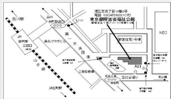
東京都障害者福祉会館